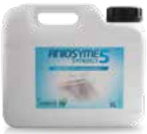
Aniosyme Synergy 5 5 L dunk

UNIKT 5-enzymatisk detergent til manuel og automatisk genbehandling