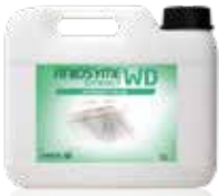
Aniosyme Synergy WD 5 L Dunk

Triple-enzymatisk middel for sofistikeret instrument genbehandling